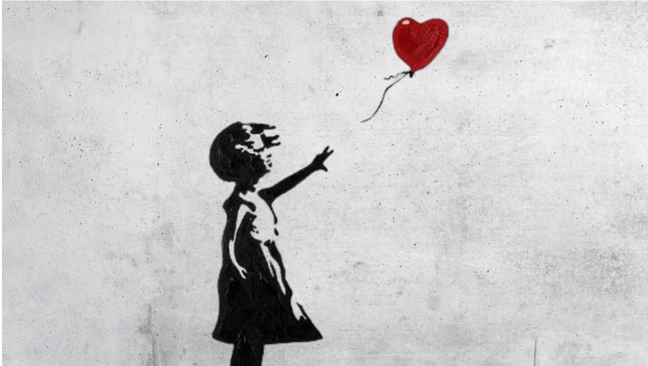
Dievčatko s balónom